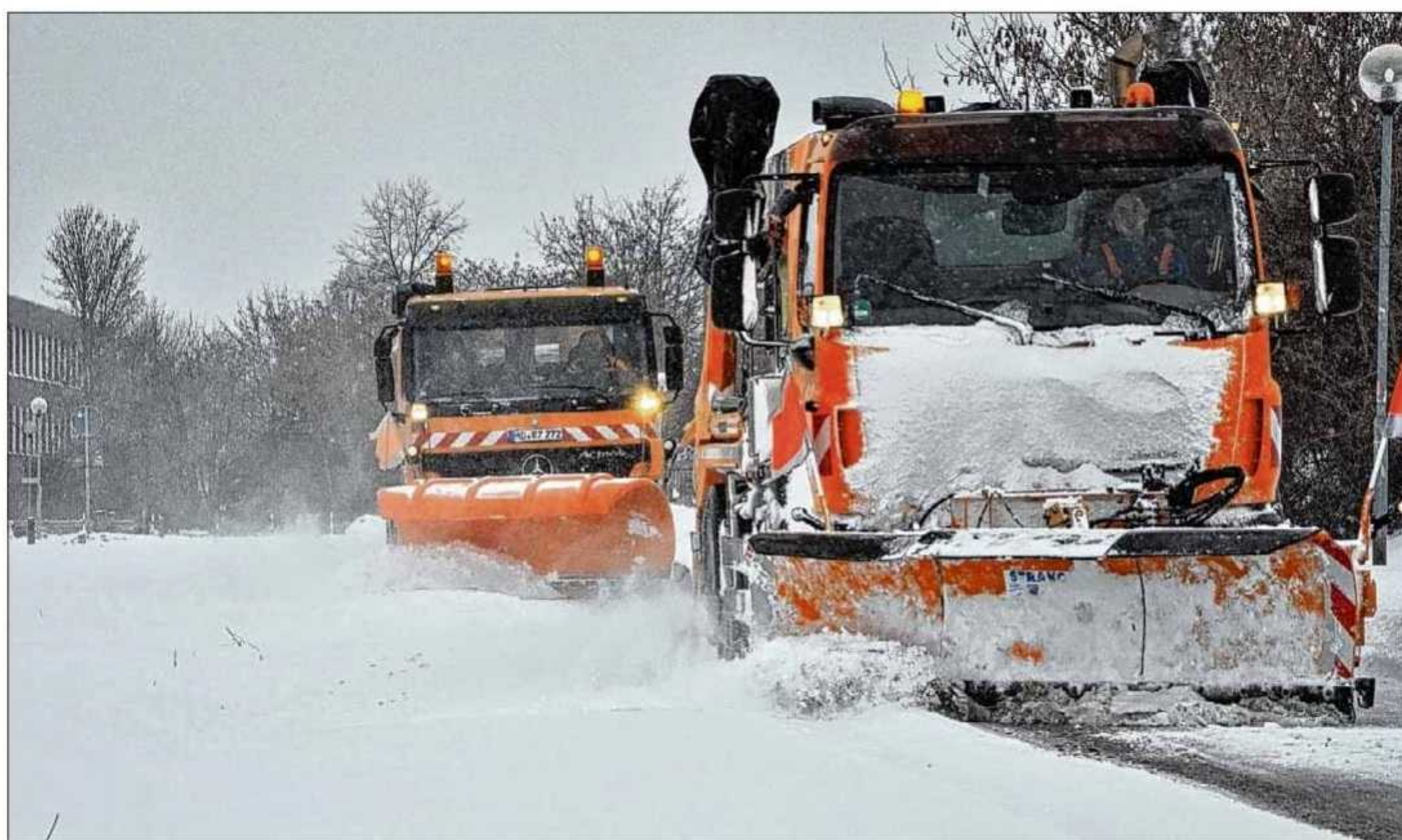
Im Verband fahren auf den Hauptverkehrsstraßen sowie bei Zufahrten von Schulen, Kitas und Altenheimen die Räumfahrzeuge.

Besonders schlimm sei es im Süden gewesen. Beispielsweise in der Schönebecker Straße. Vom Betriebshof Nord kamen die eingesetzten Bahnen zwar noch etwas weiter, doch auch hier ging nach kurzer Zeit nichts mehr. Beispielsweise auf dem