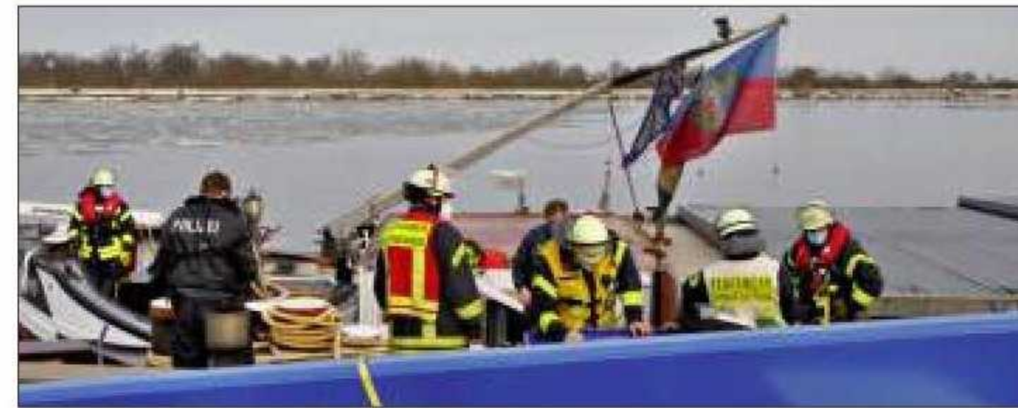
Havarie-Einsatz für die Feuerwehr an der Sparschleuse Rothensee: In ein Gütermotorschiff war Wasser eingedrungen.

Damit ist auch die Verbindung vom Kanalgebiet zur Elbe wiederhergestellt.