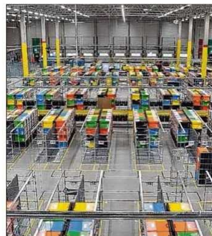
Blick in die Halle an der Grabower Straße im Norden der Stadt.

„Deshalb beobachten wir mit Spannung das Projekt ‚Traffic Guidance Infrastructure‘ in Magdeburg“, sagt die Amazon-Sprecherin mit Blick