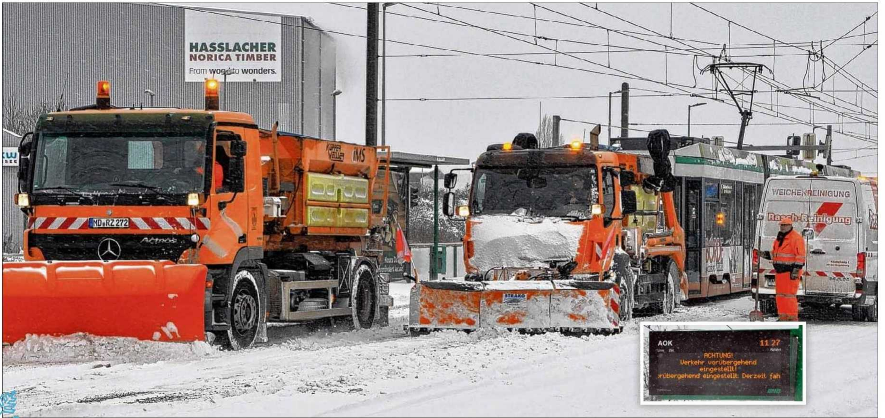
Da half auch kein doppelter Kraftprotz-Einsatz mehr: Wie hier auf dem August-Bebel-Damm ging für die Straßenbahnen im Stadtgebiet am Sonntag nichts. Vor allem die Schneewehen machten laut Verkehrsbetrieben eine sichere Fahrt nicht möglich.