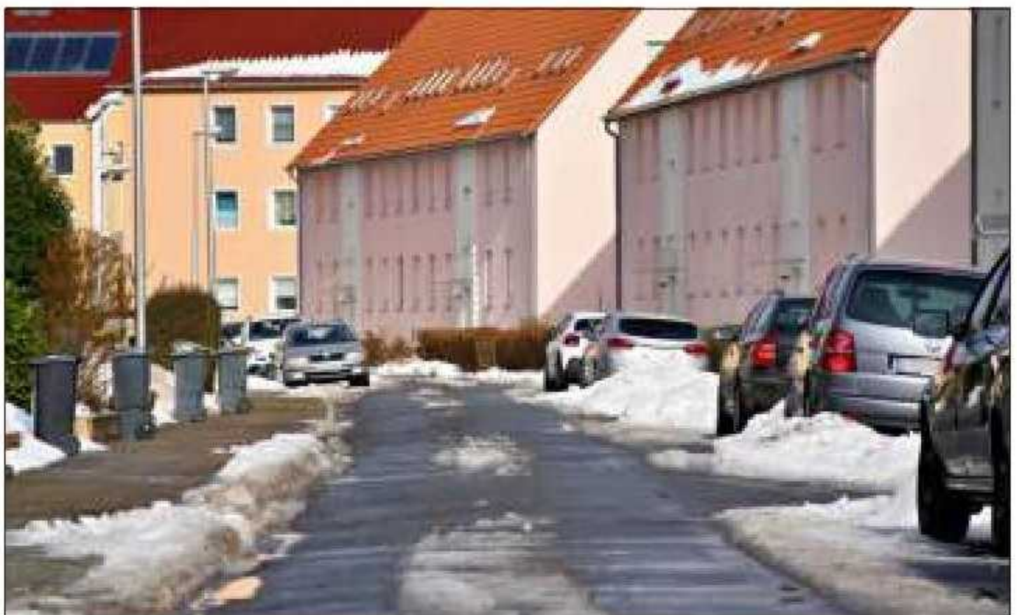
In der Fallersleber Straße in Rothensee könnten Tempo-30-Piktogramme auf die Fahrbahn gebracht werden.

Die bestehenden Piktogramme in den anderen Rothenseer Straßen würden je nach Verschleiß jährlich erneuert, erläutert der Beigeordnete zudem. „Die letzte Auffrischung erfolgte im April 2020“, erklärt er.