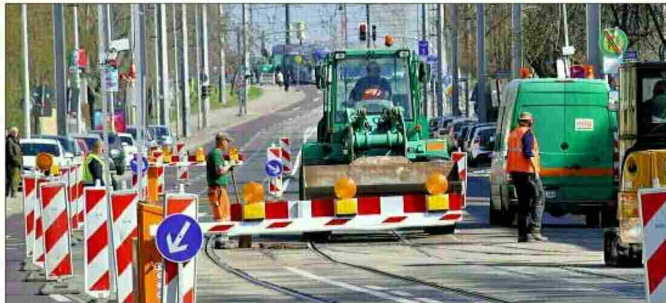
Auf der Pettenkoferstraße haben erneut Arbeiten an den Straßenbahngleisen der Magdeburger Verkehrsbetriebe (MVB) begonnen.

Zeitgleich wird auch an der Schienenanlage auf der Pettenkoferbrücke gearbeitet. Die Fahrt von Rothensee in die Innenstadt ist hier die nächsten zwei Wochen nicht möglich. Der Verkehr wird offiziell über Havelstraße, Saalestraße, Askanischer Platz und die B1 umgeleitet. Auch auf der Brücke wurden im Vorjahr bereits Gleisbauarbeiten durchgeführt. Zudem steht die grundlegende Sanierung des Bauwerks an.