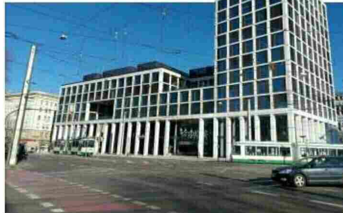
Die städtischen Werke Magdeburg haben 2021 im neuen Blauen Bock im Stadtzentrum ihren Unternehmenssitz bezogen.

Was planen Sie für das Jahr 2022? Wir arbeiten wie bisher auch weiter daran, die SWM für die Herausforderungen der anstehenden Klimaschutz- und Nachhaltigkeitsvorgaben durch Bund und Land auszurichten. Dazu gehört unter anderem der Ausbau der Fernwärme. Dies machen wir gemeinsam mit unserer Beteiligung