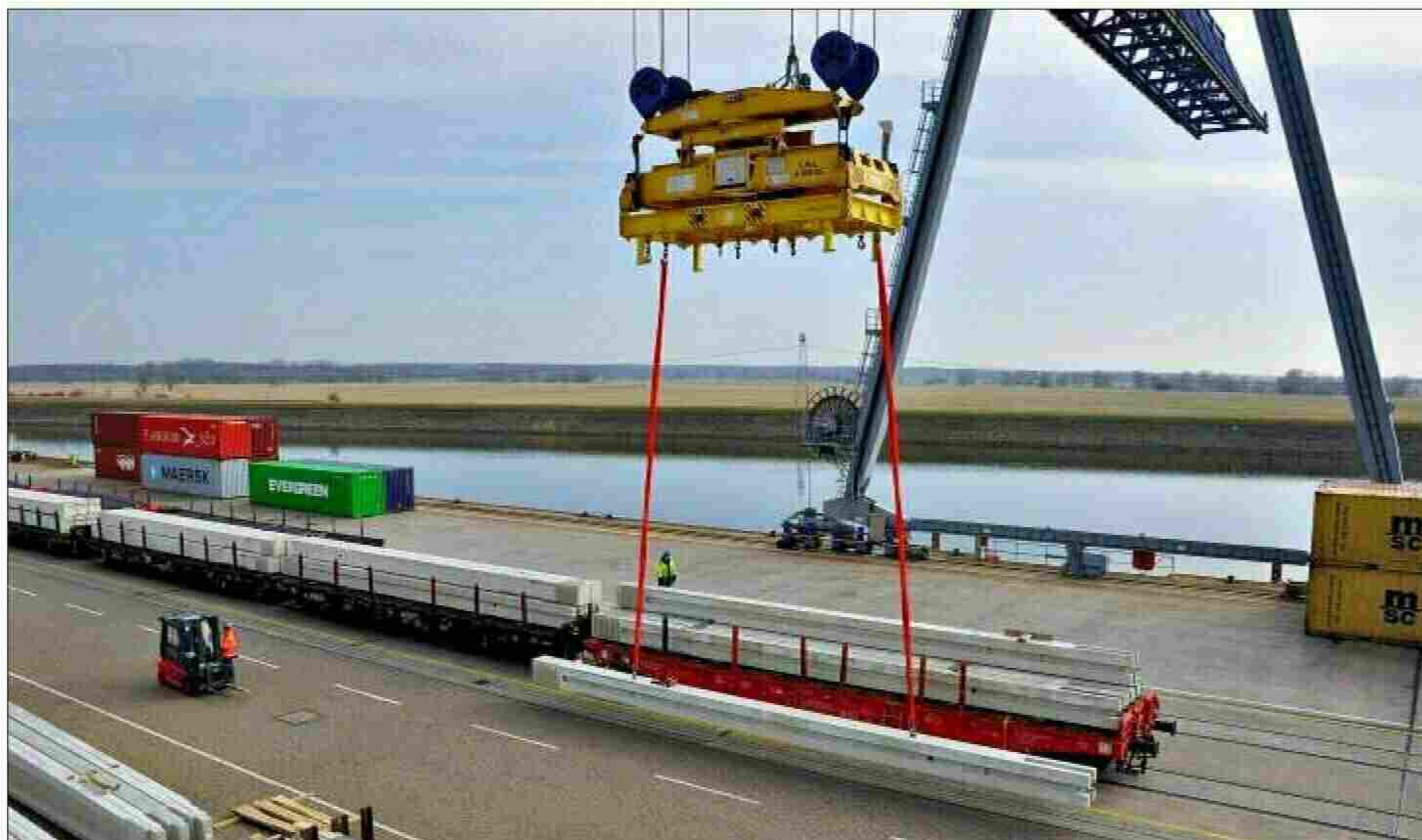
Im Hansehafen – einem der drei Häfen der Hafen GmbH – werden Betonträger von Güterwagen abgeladen. Sie werden später mit dem Lkw auf der sogenannten letzten Meile weitertransportiert. Das Unternehmen verfügt über eine Fläche von 700 Hektar über zehn Kilometer entlang der Elbe.

Zum einen steht das Thema Treibstoffe. Auch wenn die Binnenschiffer ebenso wie alle anderen in der Logistikbranche unter den hohen Preisen für Treibstoff leiden, haben sie doch einen wichtigen Trumpf auf der Hand: „Ich sehe realistische Chancen, mehr Trans-